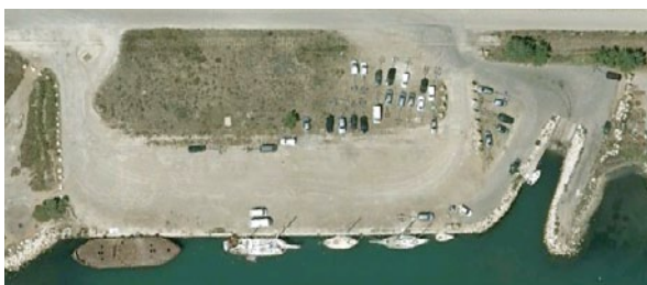
Cales de Port Saint Louis du Rhône (13)

Très nombreux conflits d'usage sur la cale de Port Abri. Rencontres et échanges de courriers en 2010 et 2011 avec Mr le Maire et Mme la Directrice des ports : non aboutis. Un projet serait à suivre en 2012: aménagement du stationnement autour de la cale ; l' AUCMED n'a pas encore été conviée à la table des concertations, courrier de relance établi. Nous y demandons une nouvelle rencontre, également pour mener une réflexion sur l'aménagement de la cale de « Ferrigno ».