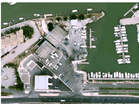
Cale de Palavas les flots (34)