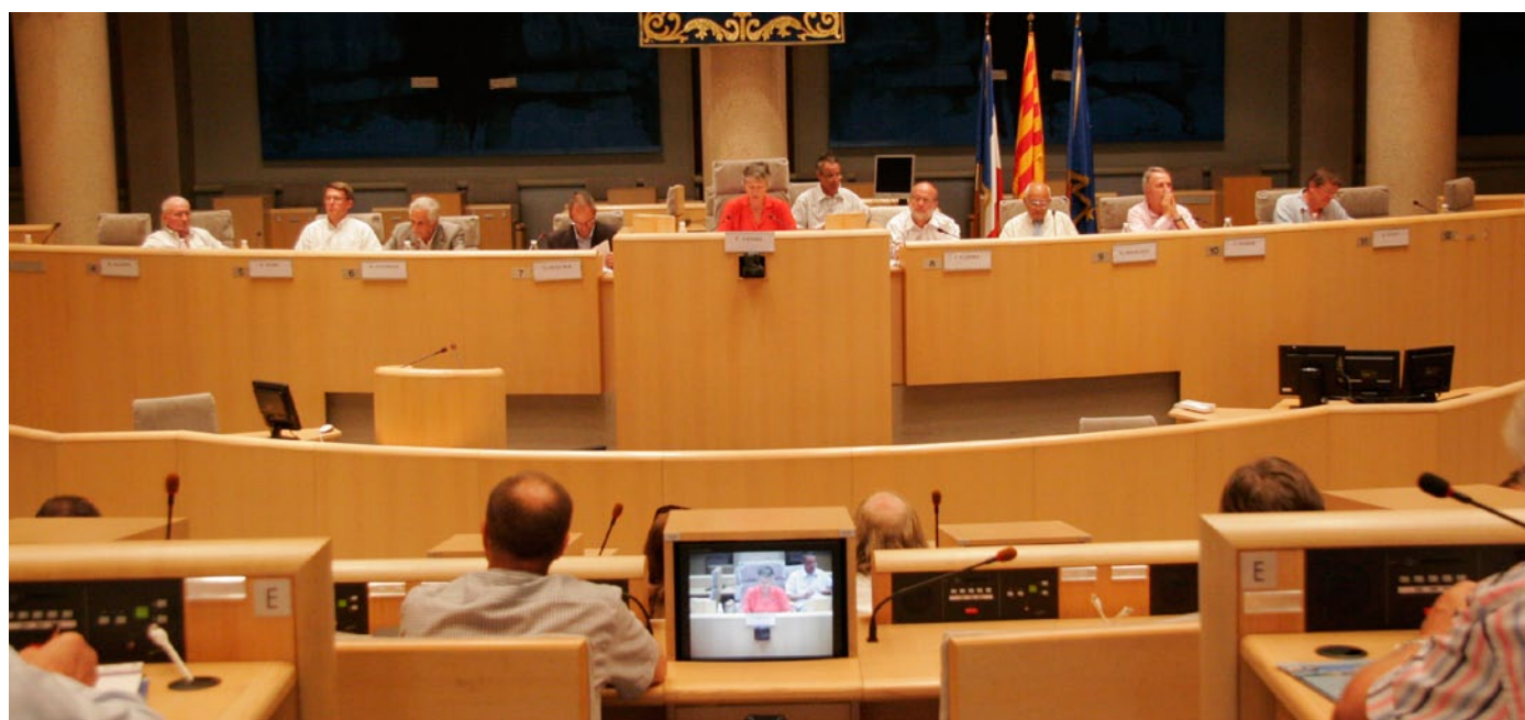
Colloque cales de mise à l'eau Réflexion collective dans le grand hémicycle / Conseil Régional PACA le 30 juin 2009 Une grande première en France à l'initiative du Conseil Régional et de l'AUCMED !