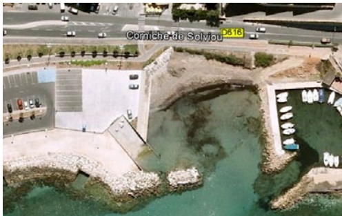
Cale de Six Fours Les Plages (83)

Récente visite (3 Mai 2012) sur place aux anciens chantiers navals, pour comprendre pourquoi cette immense cale, rénovée, publique, n'est pas utilisée. Avec l'aide de citoyens locaux, un courrier a été adressé à la Mairie pour premier contact.