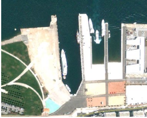
Cale de La Seyne sur mer (83)

Récente visite (3 Mai 2012) sur place aux anciens chantiers navals, pour comprendre pourquoi cette immense cale, rénovée, publique, n'est pas utilisée. Avec l'aide de citoyens locaux, un courrier a été adressé à la Mairie pour premier contact.