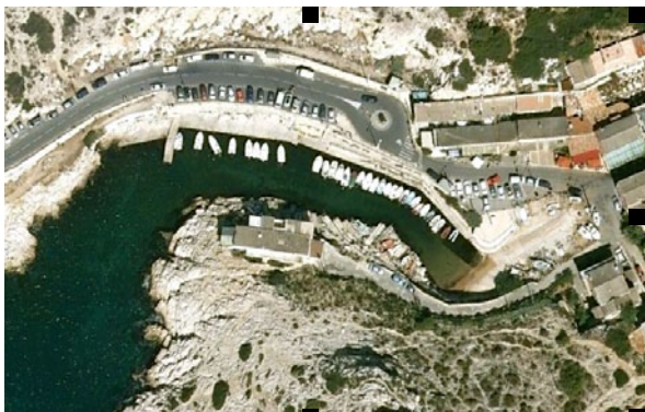
Cale de Callelongue (Marseille - 13)

Sur la demande d'associations de kayakistes ainsi que de notre partenaire l' UNANMED, l' AUCMED a participé aux démarches de rencontres avec la société nautique locale et la collectivité territoriale MPM afin de trouver une solution à un blocage de la cale du port de Callelongue. Il est demandé un accès libre par les usagers extérieurs, particulièrement les kayakistes (aucune possibilité de manœuvre ni de stationnement pour embarcations tractées), aux résidents de ce charmant petit port. Une étape d'échanges est franchie, plusieurs solutions sont en étude par Marseille Provence Métropole.