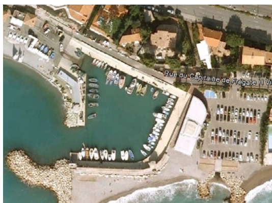
Cale du Cros De Cagne (06)