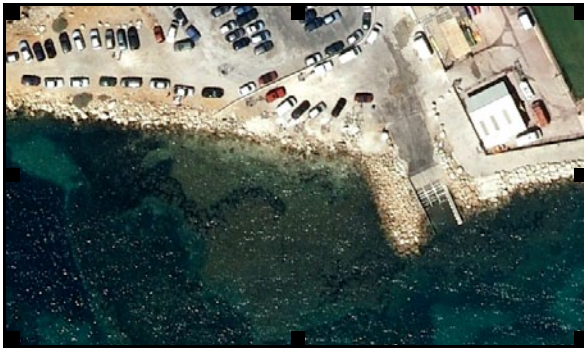
Cale de Bandol (83)

Après une première approche de l' AUCMED en 2011 non prise en compte, nouveau courrier LRAR à la Mairie début Mai 2012 pour demande d'un réaménagement et d'une remise en état de la cale : places de stationnement, signalétique, remise en état du ponton ; à suivre.