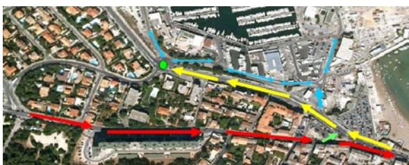
Circulation autour de la Pointe Rouge (Marseille - 13)

Depuis 2009, un très important travail a été mené avec le maître de port de la Pointe Rouge : propositions d'améliorations des cales existantes, prévisions de travaux pour les saisons 2012 et plus... Quelques points de ce dossier conséquent sont avancés pour 2012, tant en étude qu'en proche réalisation. D'autres méritent une plus lointaine échéance, vu l'ampleur et le financement des travaux. Le relationnel établi avec la Direction des Ports de MPM est très bon, l' AUCMED est écoutée, à suivre de près.