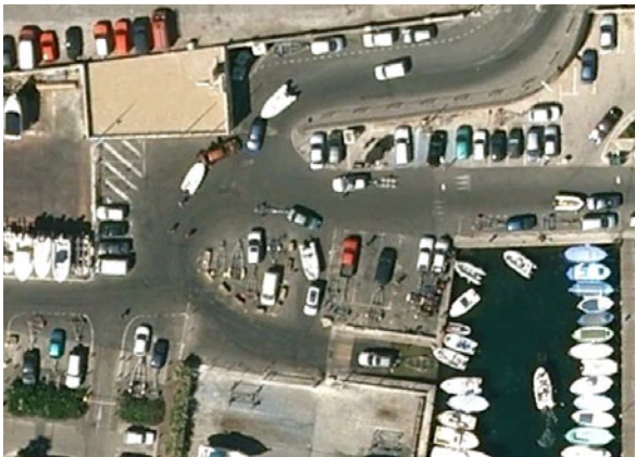
Cale de La Ciotat (13)

Après une première approche de l' AUCMED en 2011 non prise en compte, nouveau courrier LRAR à la Mairie début Mai 2012 pour demande d'un réaménagement et d'une remise en état de la cale : places de stationnement, signalétique, remise en état du ponton ; à suivre.