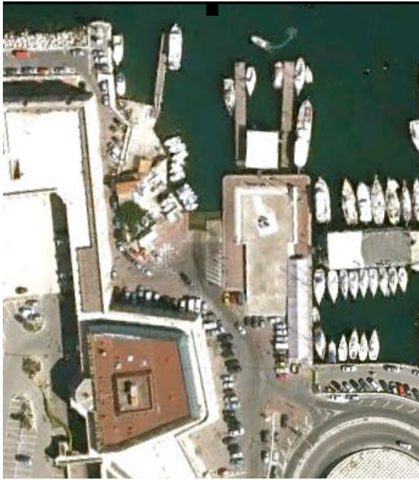
Cale du Vieux Port de Marseille (13)

Cale impraticable car emprise chantier réglementée « tunnel Prado » jusqu'au 31 Octobre 2012 ; signalé à MPM dans un de nos courriers + inquiétudes de la disparition de la cale suite à la création de Vieux-Port piétonnier. L'élu au nautisme a également été saisi par l' AUCMED . Réaménagement de la cale à étudier avec la Direction des Ports de MPM pour l'hiver 2012. Vieux-Port piétonnier . à suivre de « 2013 à 2020 ».