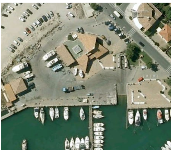
Cale des Saintes Maries de La Mer (13)

Très nombreux conflits d'usage sur la cale de Port Abri. Rencontres et échanges de courriers en 2010 et 2011 avec Mr le Maire et Mme la Directrice des ports : non aboutis. Un projet serait à suivre en 2012: aménagement du stationnement autour de la cale ; l' AUCMED n'a pas encore été conviée à la table des concertations, courrier de relance établi. Nous y demandons une nouvelle rencontre, également pour mener une réflexion sur l'aménagement de la cale de « Ferrigno ».