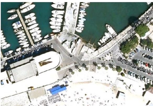
Cale de Cassis (13)

Depuis 2010, courriers sans suite réellement approfondie par les élus et gestionnaires (Ville de La Ciotat, Marseille Provence Métropole, SEMIDEP). Le déplacement annoncé du port à sec permettrait de créer de nombreux emplacement de stationnement bien pensés ; Nous suivons cette opération de près, avec la Direction des Ports de MPM, récemment rencontrée à nouveau. Courrier de relance fin avril 2012 ; l' AUCMED demande par ailleurs la création d'une grande mise à l'eau sur les anciens chantiers navals, à présent gérés par la SEMIDEP.