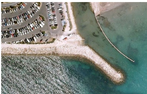
Cale de Sanary Sur Mer (83)

L' AUCMED a envoyé un courrier à la Mairie début Mai 2012 pour comprendre pourquoi cette cale « neuve de moins de 5 ans » est barrée par des blocs béton. L'objectif est une réouverture et un réaménagement au plus tôt. Attente d'un retour à notre LRAR pour rendez-vous à planifier.