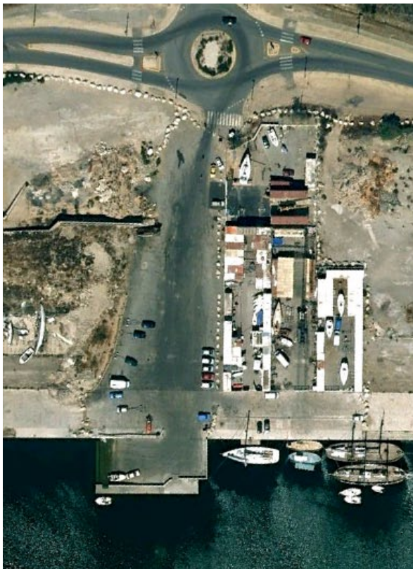
Cale de l'Estaque (Marseille - 13)

Cale impraticable car emprise chantier réglementée « tunnel Prado » jusqu'au 31 Octobre 2012 ; signalé à MPM dans un de nos courriers + inquiétudes de la disparition de la cale suite à la création de Vieux-Port piétonnier. L'élu au nautisme a également été saisi par l' AUCMED . Réaménagement de la cale à étudier avec la Direction des Ports de MPM pour l'hiver 2012. Vieux-Port piétonnier . à suivre de « 2013 à 2020 ».