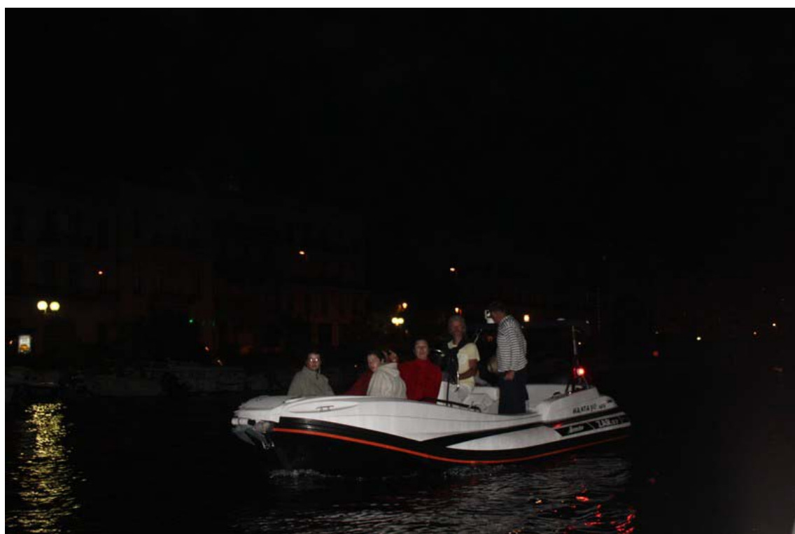
En route pour une petite navigation de nuit...