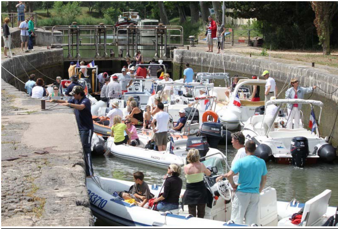
Arrivée à l'écluse du Blagnas