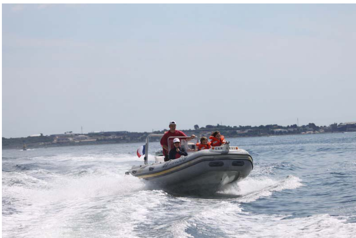
Sur l'étang de Thau, 30 kilomètres de long sur 6 de large...