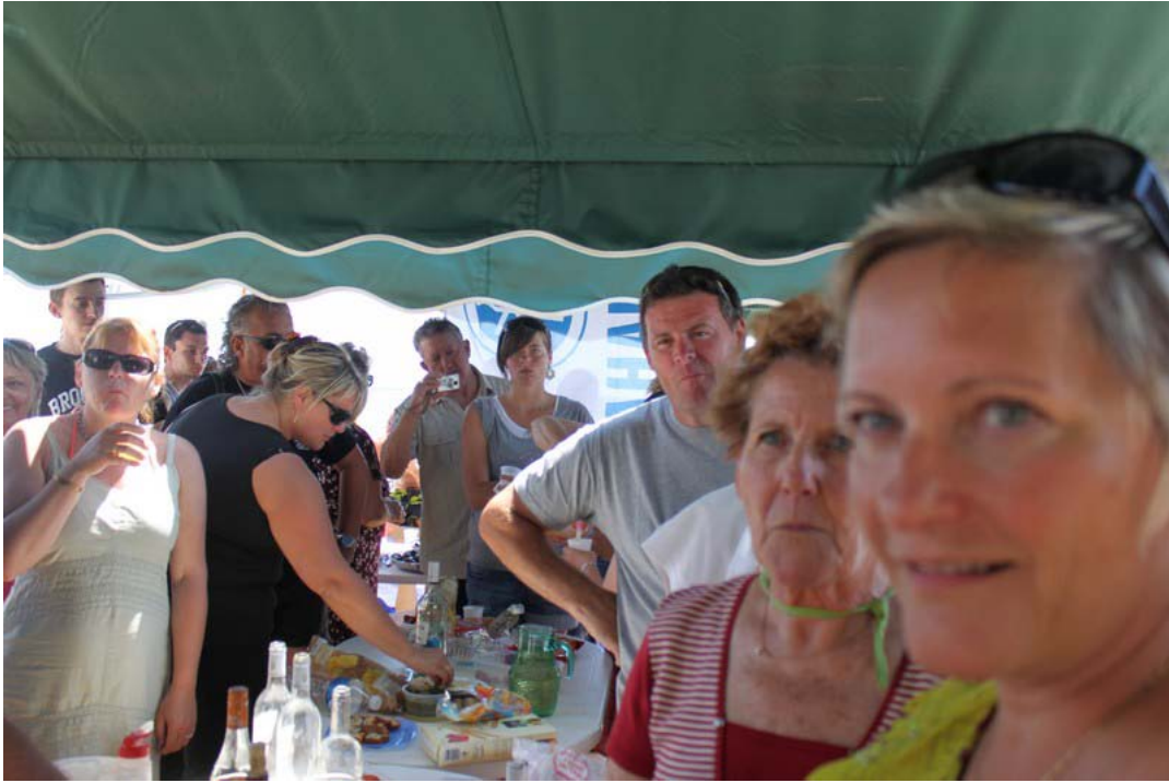
Whaou ...les bouteilles vides...