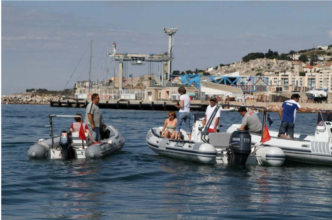
Pour le lancement du petit jeu/découverte...