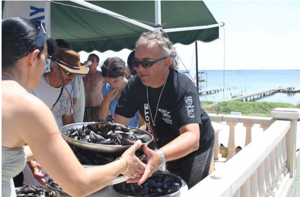
Attention...chaud devant !!!