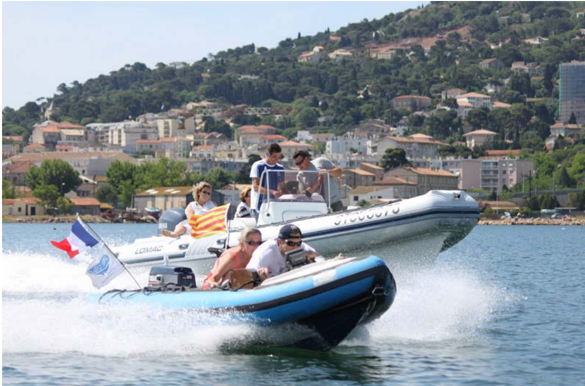
Du gros au petit...