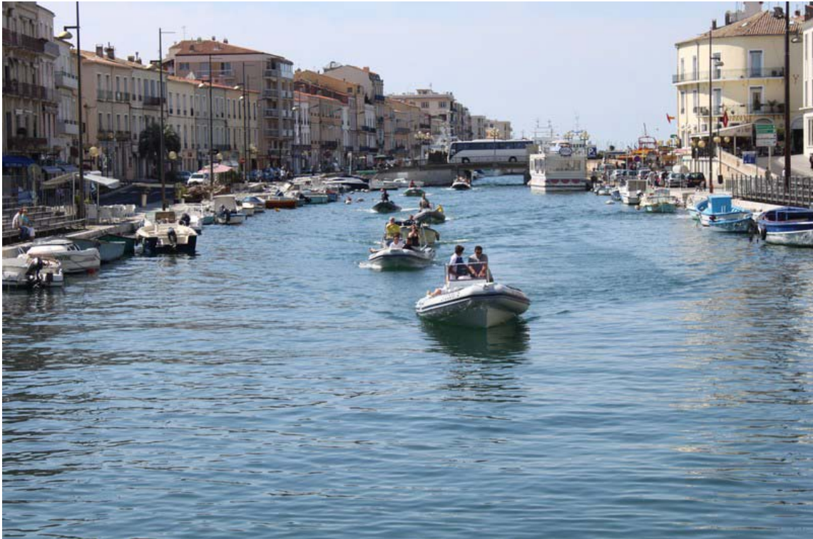
Avec l'habitude visite de la ville...