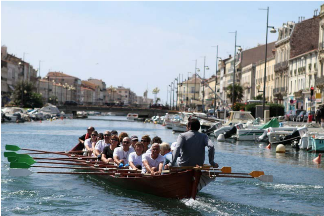
Ainsi que d'autres activités nautiques...