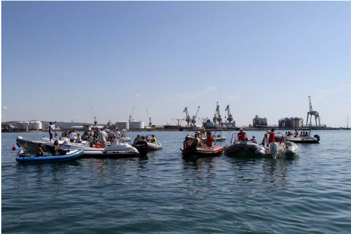
Le lendemain Dimanche, regroupement dans Sète...