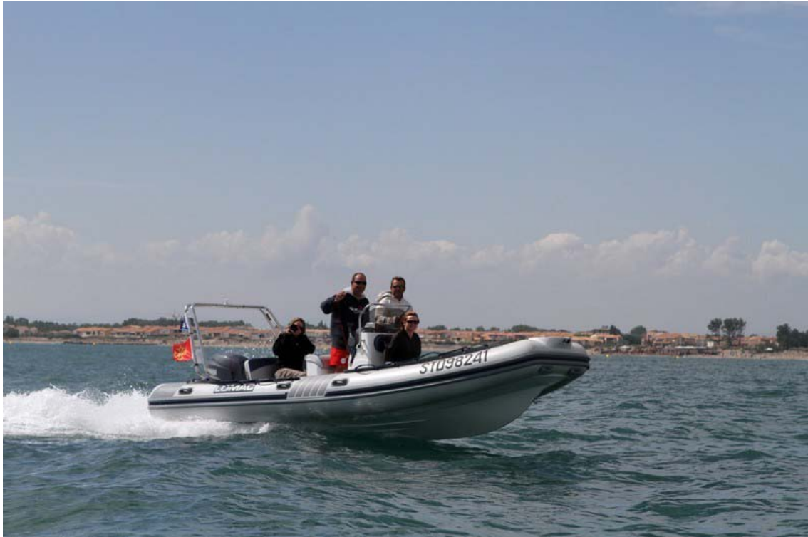
On décrasse un peu les moulins...