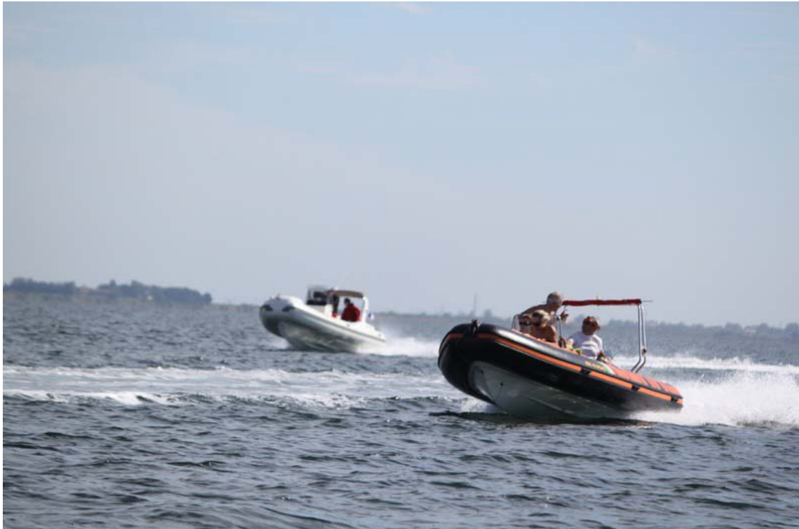
Pour rallier le Centre du Taurus de Mèzes...