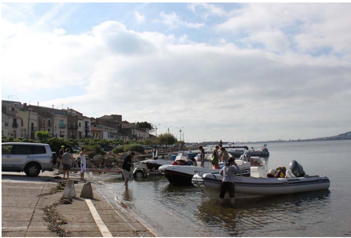
Samedi matin, mise à l'eau de 14 bateaux...