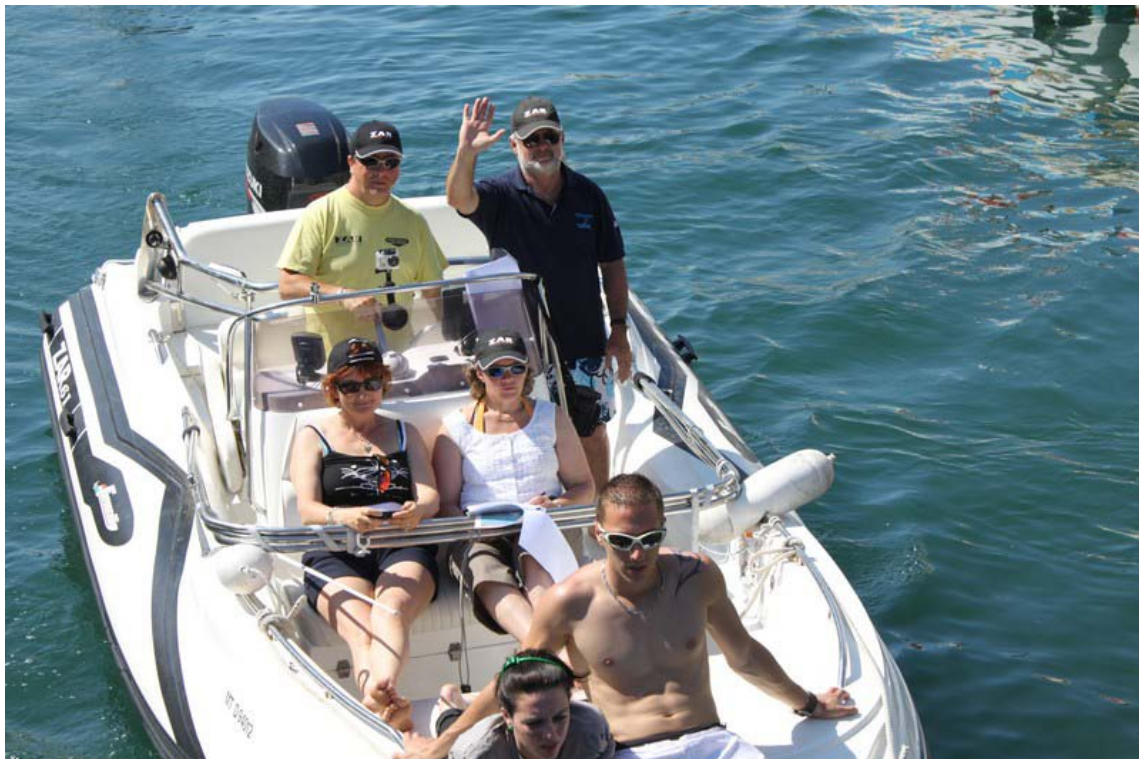
Cool la visite...