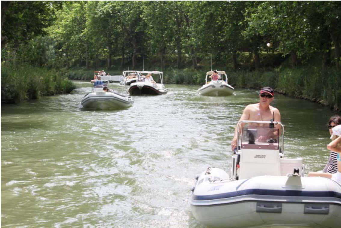
Promenade bucolique sur le Canal du Midi...