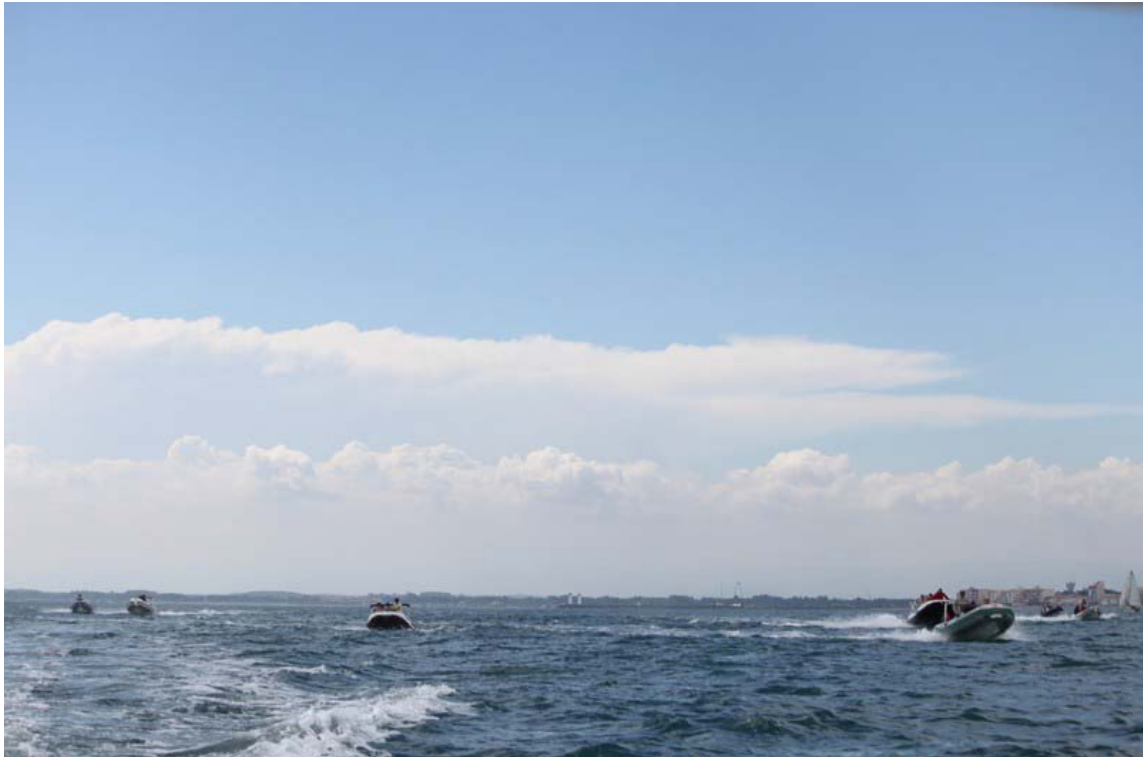
Après avoir retrouvé la mer...