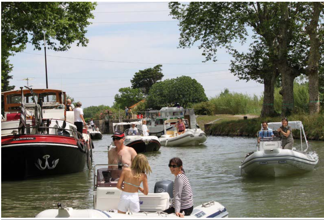
Et sortie 1,50 mètre plus haut...