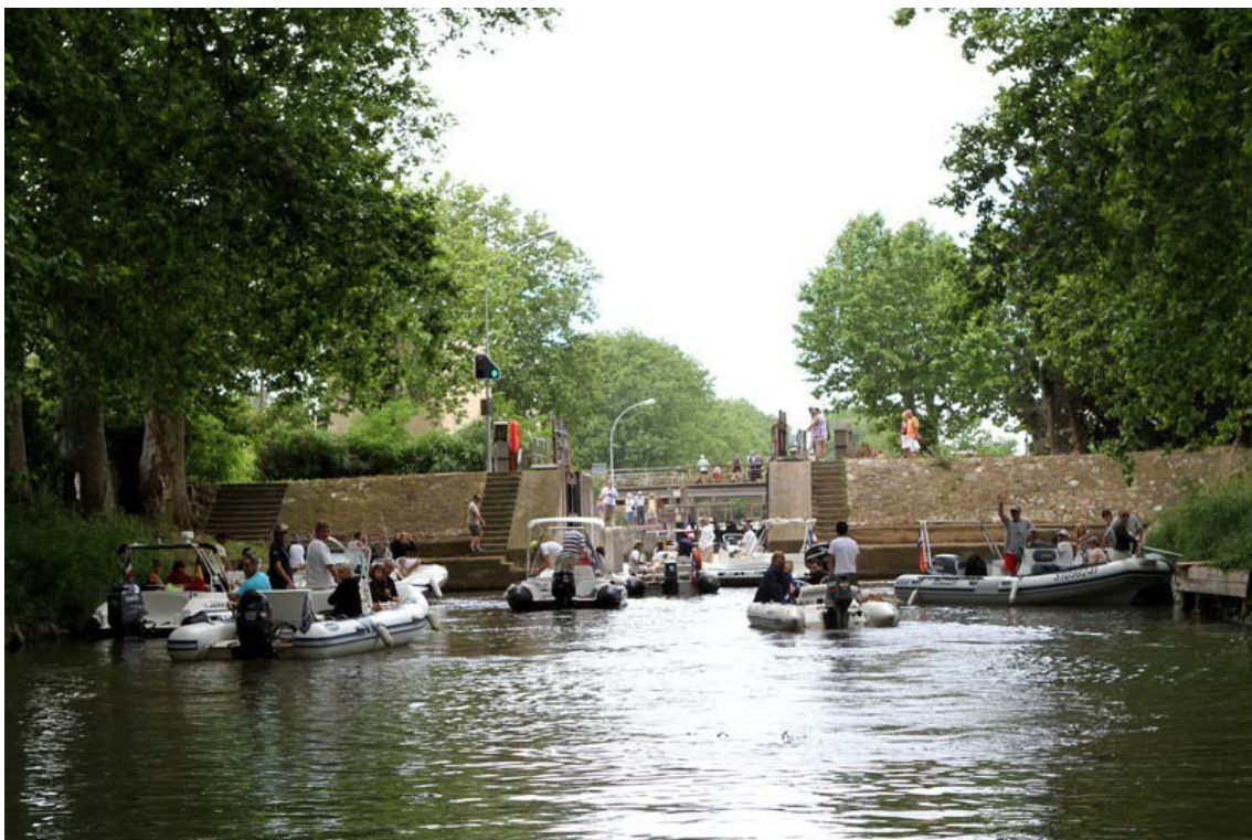
Jusqu'à la seconde écluse « Ronde »...