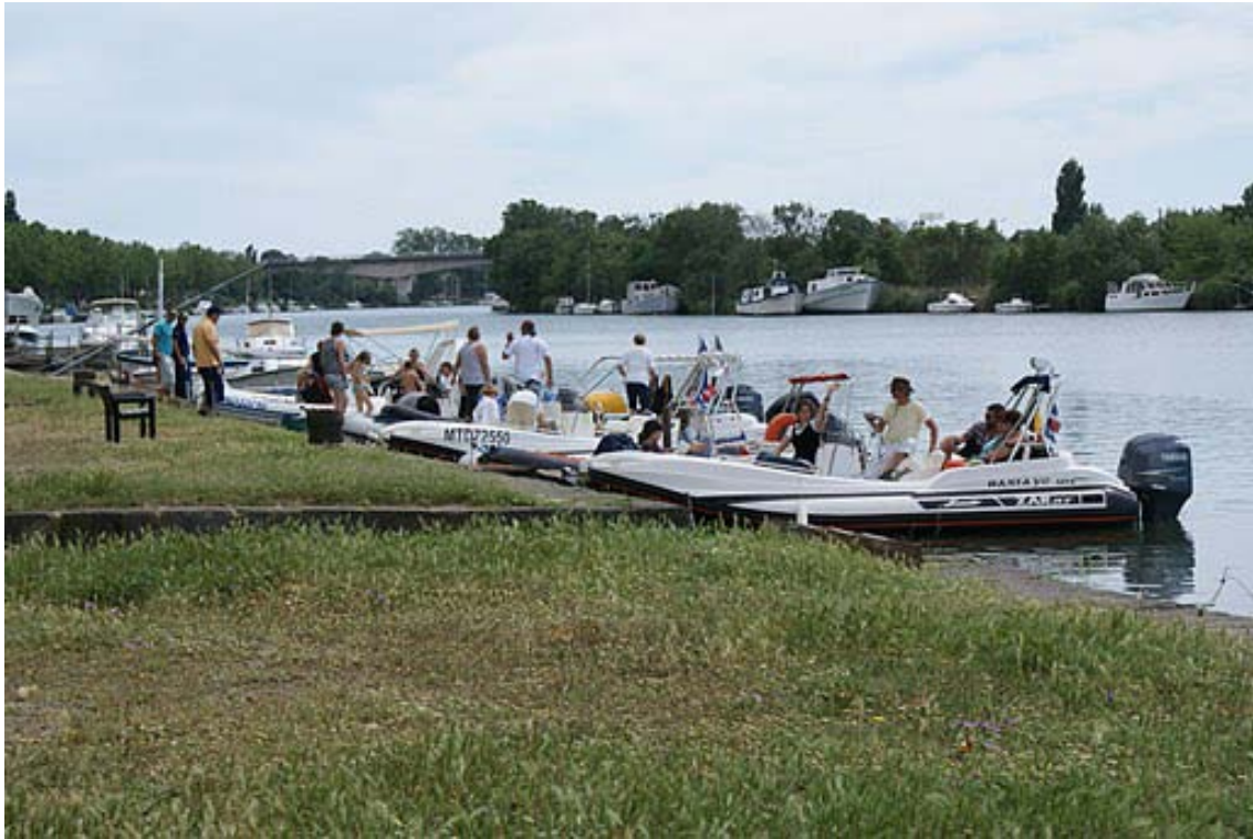
Halte pique-nique sur les berges...