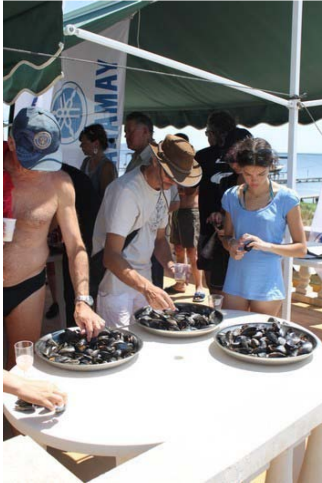
Les moules ravivent nos papilles...