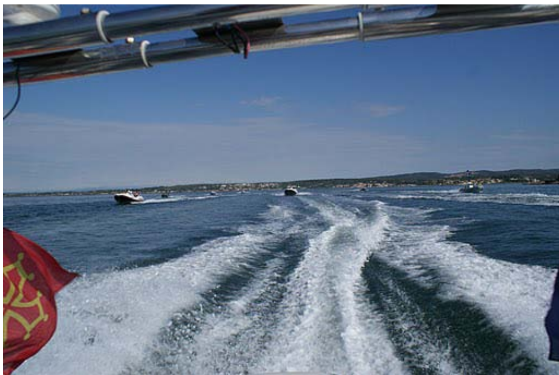
Tout le monde se régale...