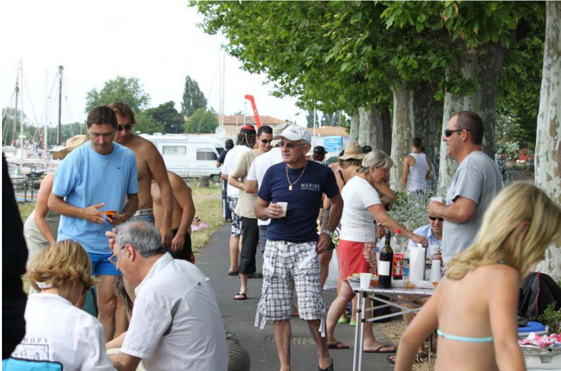
On commençait à avoir faim...