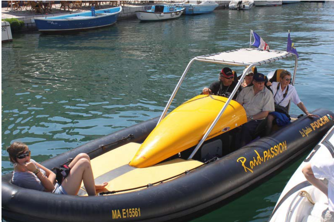
Les Marseillais bien à l'ombre...