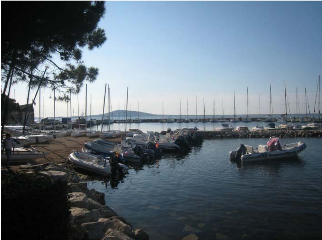
Qui nous servira de base pour le weekend...