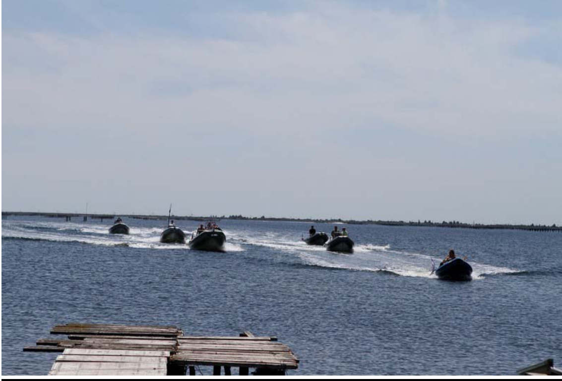
Arrivée à Marseillan...