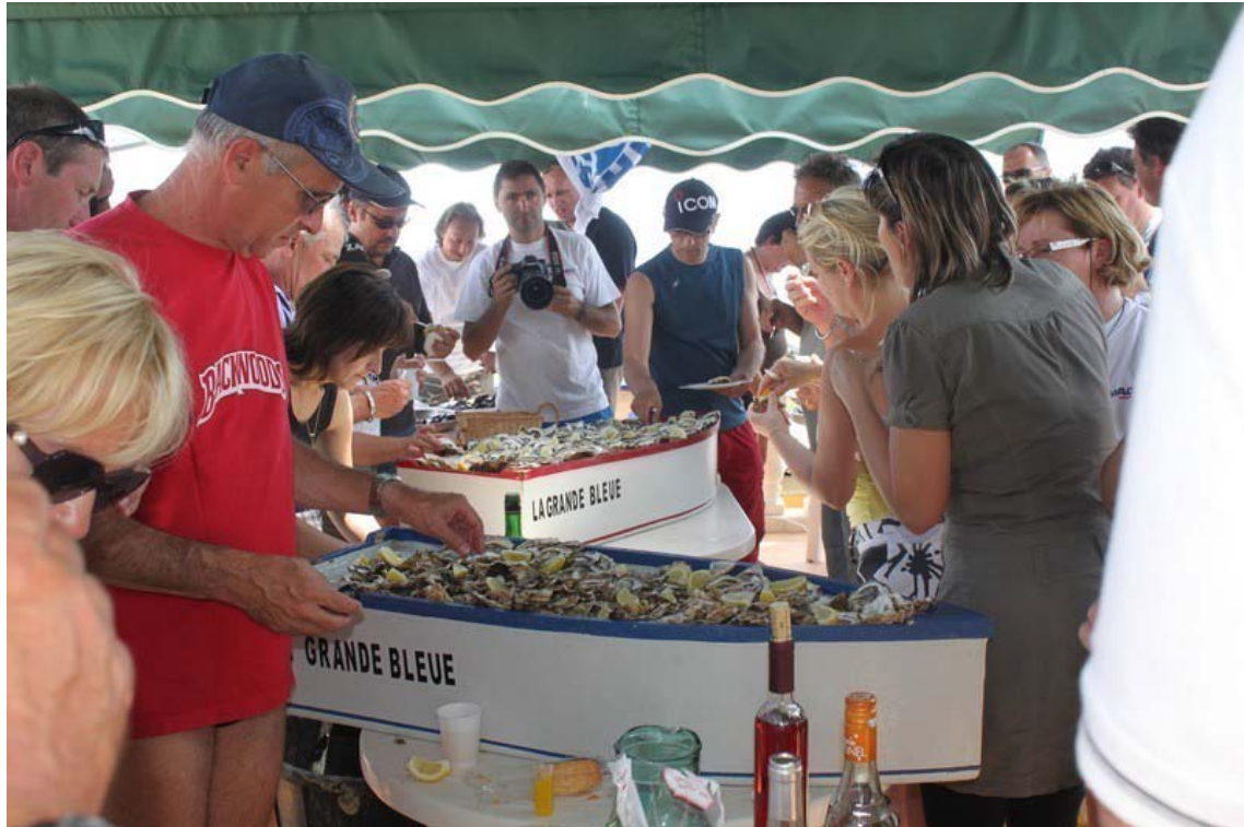
la BRASUCADE !!!