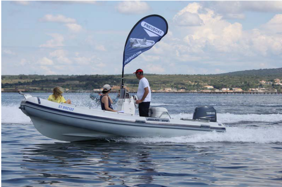
Mavac30 porte les couleurs Pneuboat...