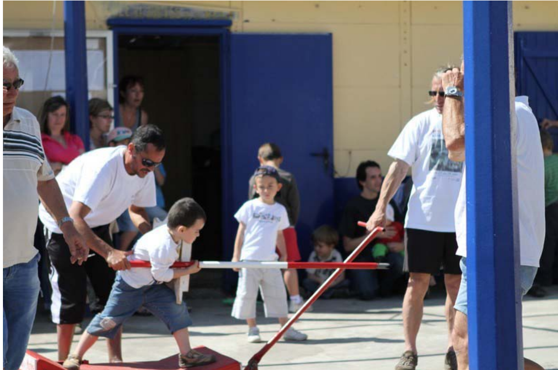
Ou tout s'apprend dès le plus jeune âge...école des Joutes...