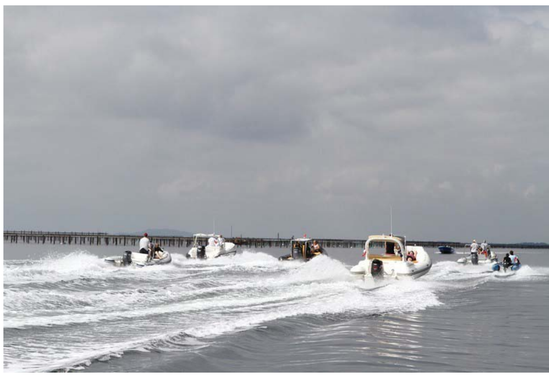
et départ de Bouzigues...