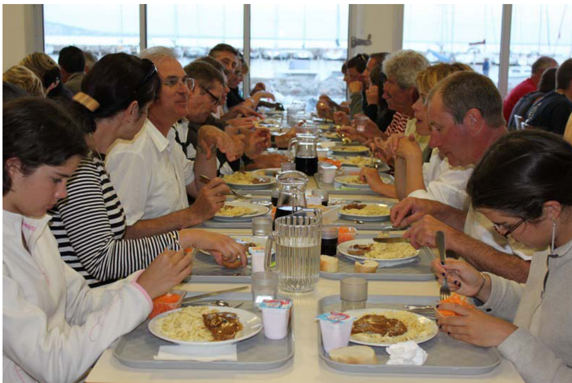
Suivi du repas du soir pris dans la convivialité...