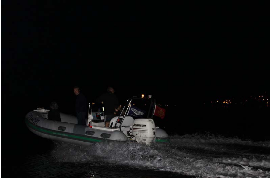
Guidée par Thierry34...