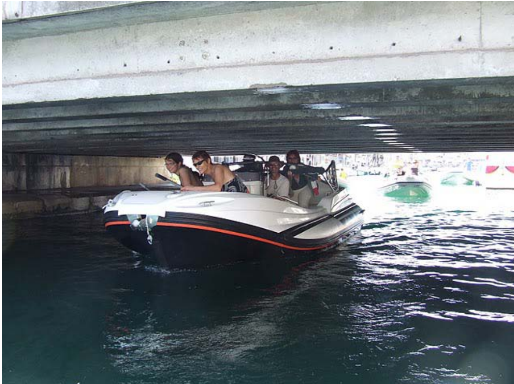
Tandis que d'autres découvrent les difficultés locales...