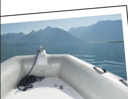
LE BAIN DE SOLEIL A l'avant la plage est imposante. Plus de deux mètres pour s'allonger, les ortieils en éventail. Avec les Alpes en toile de fond.