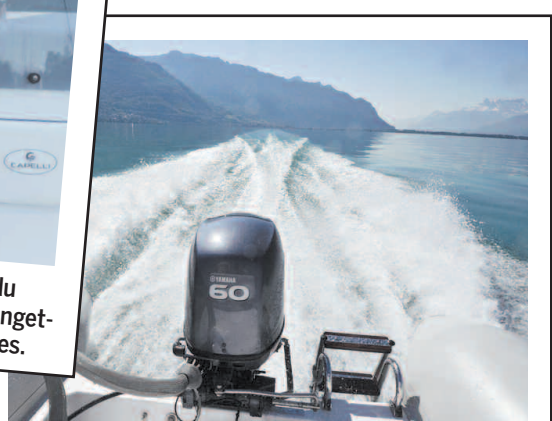
À FOND LA CAISSE Le Yamaha procure de jolies sensations sur cette unité de 5 m. Capable de dépasser largement les 50 km/h avec deux occupants.