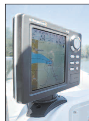
LE GPS Ce modèle combine la lecture de carte avec un sondeur bi-fréquence.