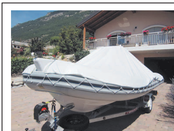
PRÊT AU DÉPART L'attelage pèse pas loin de 700 kilos, remorque comprise. A 80 km/h sur les autoroutes suisses, mieux vaut ne pas être pressé.

veret. Mais vous n'y trouverez presque pas de pneumatiques, même de taille respectable. Flotteurs montés sur une coque en polyester découpée en un V plus ou moins profond, les semi-rigides sont à la plaisance ce que les caravanes sont au tourisme itinérant. Légers, maniables, de conception aussi simple que pratique, les SR se transportent aisément. C'est même leur vocation première. A partir de six mètres de longueur, ils peuvent offrir en prime le couchage à leurs occupants. Un igloo monté sur le bain de soleil avant, un second sur la banquette arrière rabattable et voilà quatre plaisanciers logés. Le confort est sans doute un brin spartiate, la place comptée, mais pas davantage qu'aux campeurs sous leurs tentes.