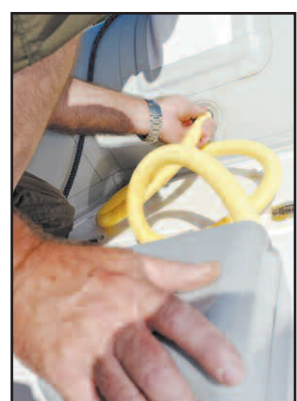
LE GONFLEUR de préférence électrique, il s'arrête à la bonne pression, ici 2 bars.