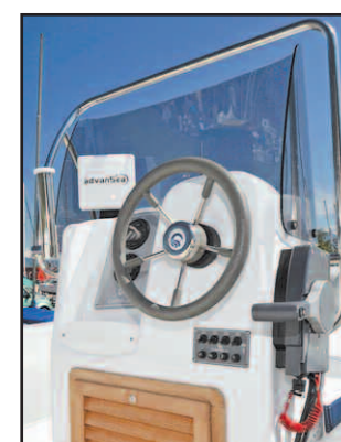
LA CONSOLE Elle abrite les commandes manuelles et l'électronique, en option.