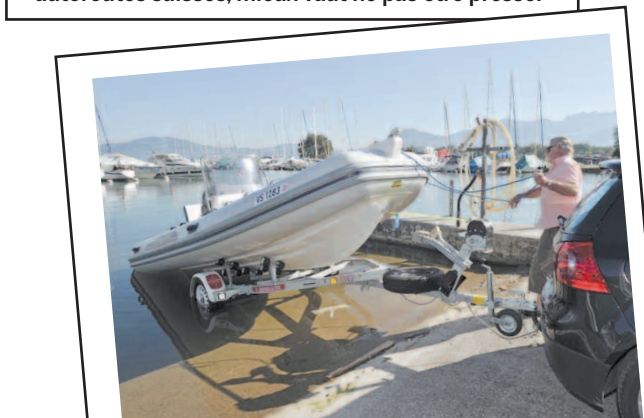
MISE À L'EAU Un jeu d'enfant. Il faut quand même le permis, comme pour tout bateau équipé d'un moteur supérieur à 8 ch.