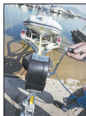
LE TREUIL A deux vitesses, ce modèle peut halier sans effort jusqu'à 1200 kilos.