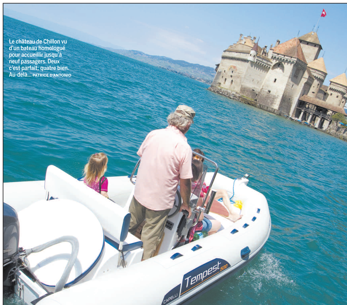
Le château de Chillon vu d'un bateau homologué pour accueillir jusqu'à neuf passagers. Deux c'est parfait, quatre bien. Au-delà... PATRICE D'ANTONIO