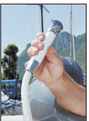
LA DOUCHETTE Sans doute un luxe au lac, mais un vrai confort à la mer.